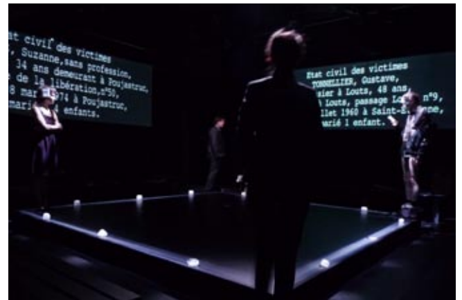
LA TÊTE VIDE (2009)