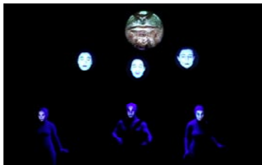
PLOUTOS CIRCUS (2009)