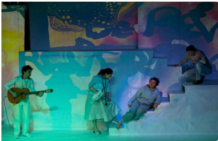
■ Après grand, c'est comment? Un spectacle coloré et poétique pour prendre le temps de respirer.

Collectif 7 crée là un spectacle optimiste, positif, débordant de poésie. Dont c'était la première vendredi au Centre culturel. Innovant aussi par sa mise en scène signée Muriel Coadou. Dans une forme qui se feuillette comme un livre d'enfant. De ces albums animés à l'ancienne où l'image se déplie en relief et révèle ses secrets colorés. Et ses petits personnages qu'on actionne avec des tirettes, comme autant de marionnettes en miniature. ■