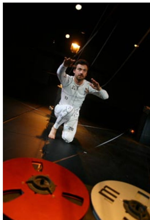
CE DOIT ÊTRE TENTANT D'ÊTRE DIEU (2008)