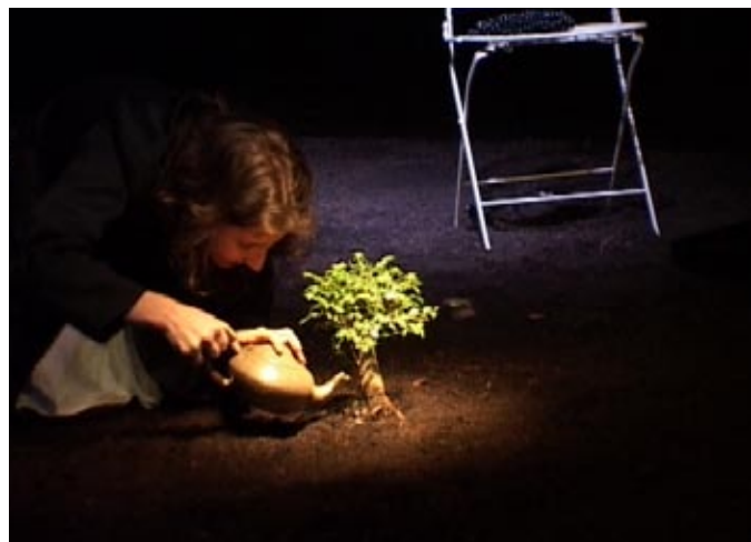
RUE DU RETOURNE-T'EN (2005)