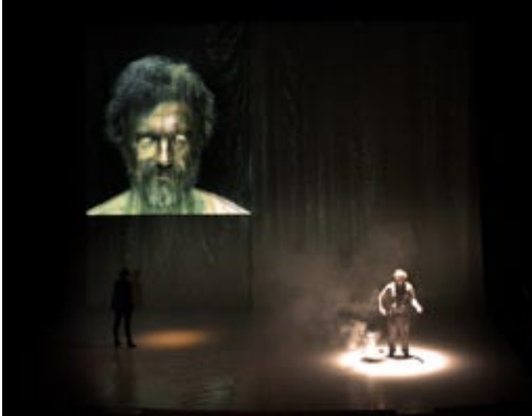
PLOUTOS INDOOR (2012) METAMORPHOSE