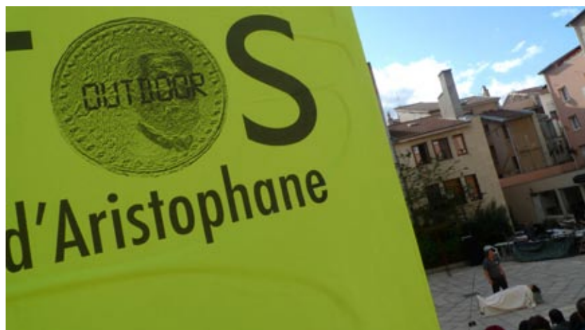
PLOUTOS OUTDOOR (2011)