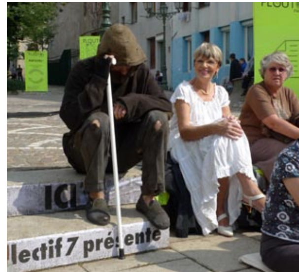
PLOUTOS OUTDOOR (2011)